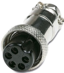
DIM 5 pines hembra