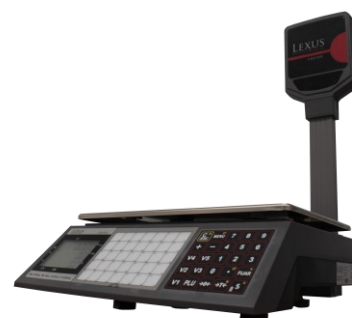
FOXTER T 70